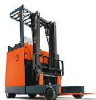
4輪、立ち式リーチ電動フォークリフト (1~3トン)