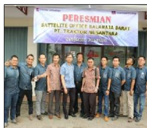
タンゲラン事務所 (Balarama)