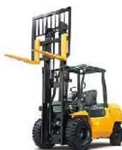
エンジンフォークリフト (1~24トン)