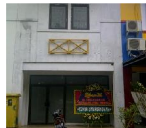
カラン事務所 (KIIC近く)